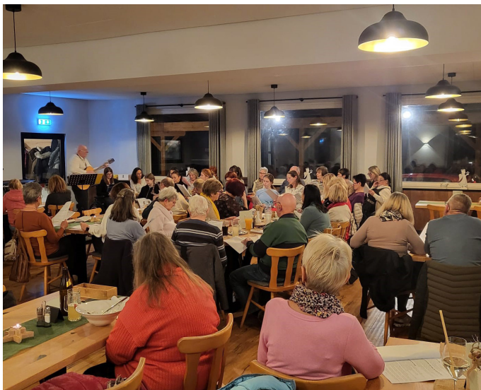
Sing ma mitanaund im GH Karnerwirt, 14.12.2023

Danke an die vielen fleißigen Helferinnen und Helfer, Standlerinnen und Standler die für den reibungslosen Ablauf sorgten. Wir freuen uns jetzt schon auf unseren Adventmarkt 2024!