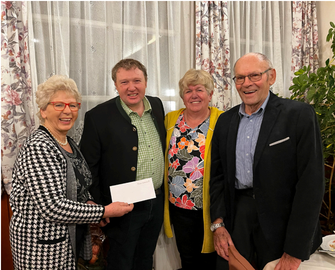
Weihnachtsfeier Seniorenverein Pernitz-Muggendorf, 30.11.2023