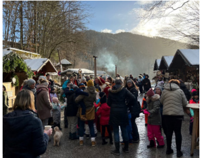
Adventmarkt 09. und 10. Dezember 2023