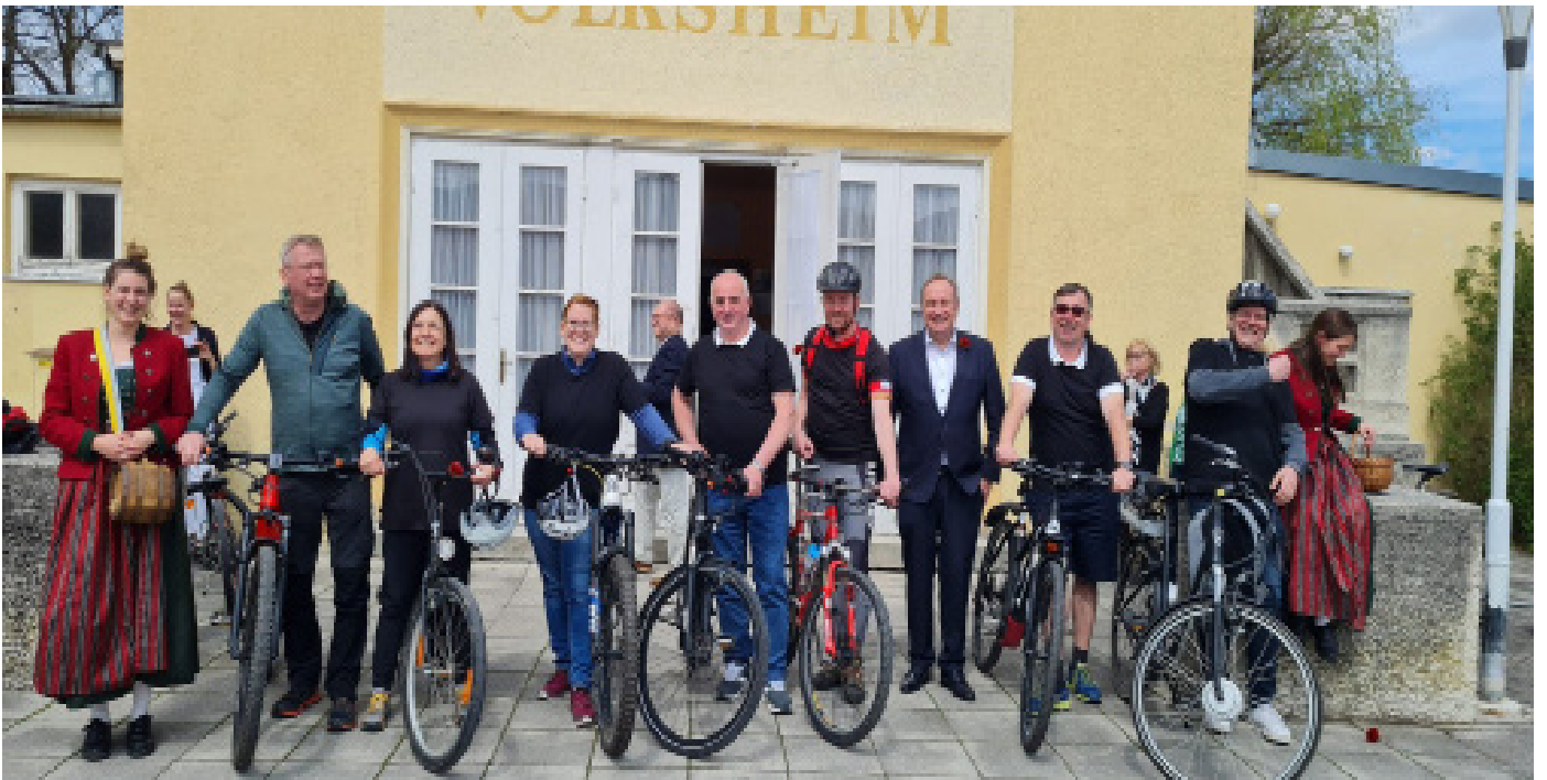
01. Mai 2023 Radausflug der Bürgermeister der Piestingtalgemeinden