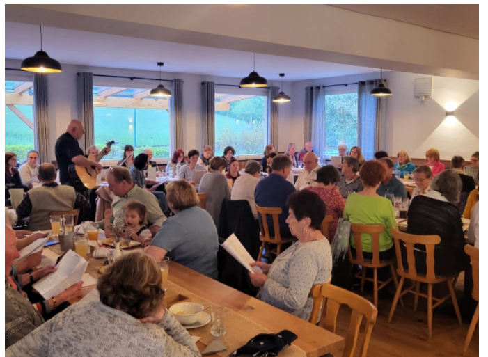
12. Mai 2023 Sing ma mitanaund beim Karnerwirt