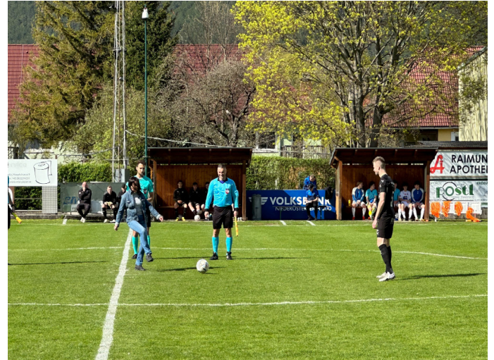
29. April 2023 Ankick sowie Matchpatronanz beim SC Ortmann