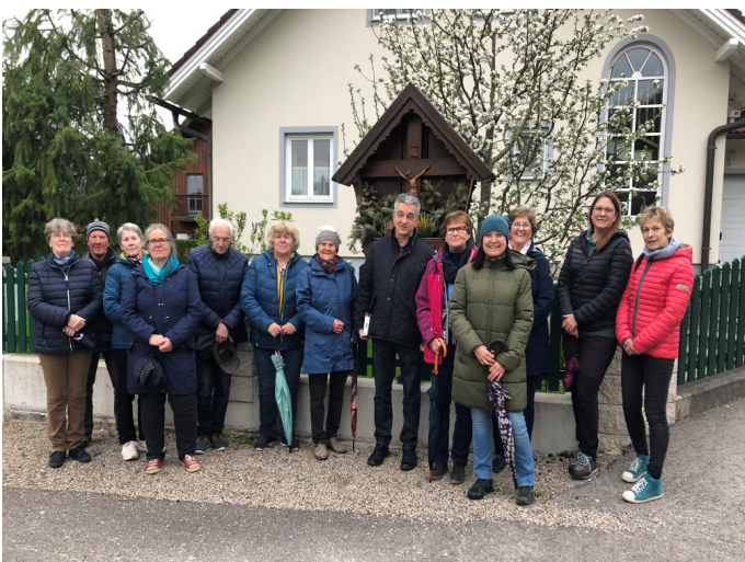
03. Mai 2023 Bittgang